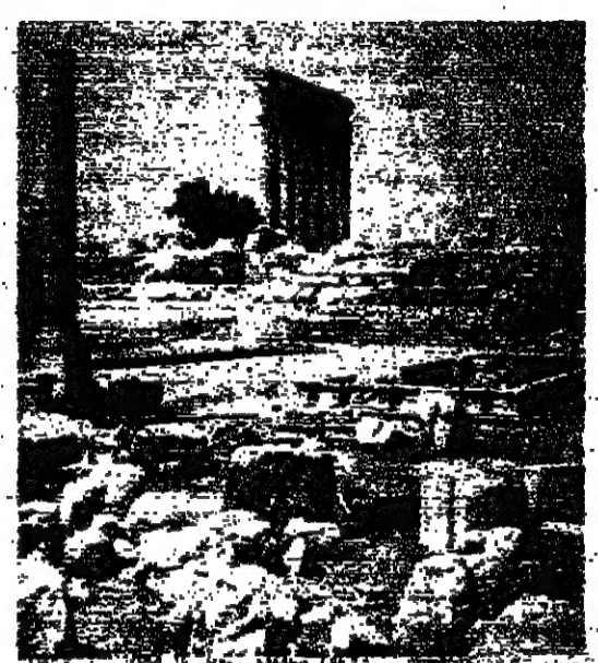
بعليك تستعيد حركتها